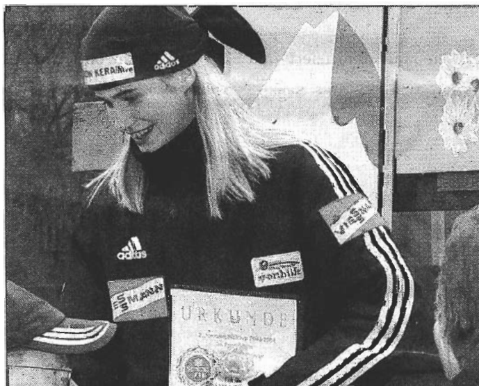
Die Rennrodlerin Natalie Geisenberger krönte ihr Super-Jahr mit dem Gewinn im Nachwuchsbereich.

Die ersten sieben Athleten der Erwachsenen sowie die ersten drei Nachwuchssportler werden bei einer großen Gala Mitte Mai im Beisein von Prominenz aus Sport, Politik und Gesellschaft feierlich geehrt. Zehn Leser, die sich bei unserer Wahl beteiligt haben, haben ebenfalls die Chance, mit Begleitung an diesem Abend teilzunehmen. Demnächst werden die zahlreichen Gewinne, Preise und Gutscheine unter allen 7410 eingesendeten Original-Coupons verlost.