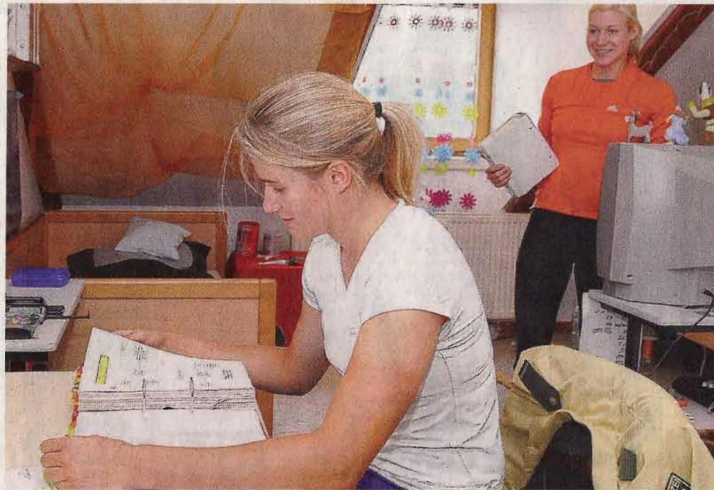
Die nächsten Prüfungen stehen an: Natalie Geisenberger und Amelie Kober bereiten sich oft gemeinsam in ihrem Zimmer vor, während die Rodlerin sich zum Büffeln lieber an den Schreibtisch setzt ...

Was den Unterricht in der Sportschule anbelangt, der von April bis August den Alltag der besten Sportler Deutschlands bestimmt, herr-